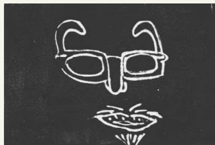
Gravure de Taïs Villeret (6°5)

On ne peut pas tout dire en un seul article, mais parlez-en à vos proches .