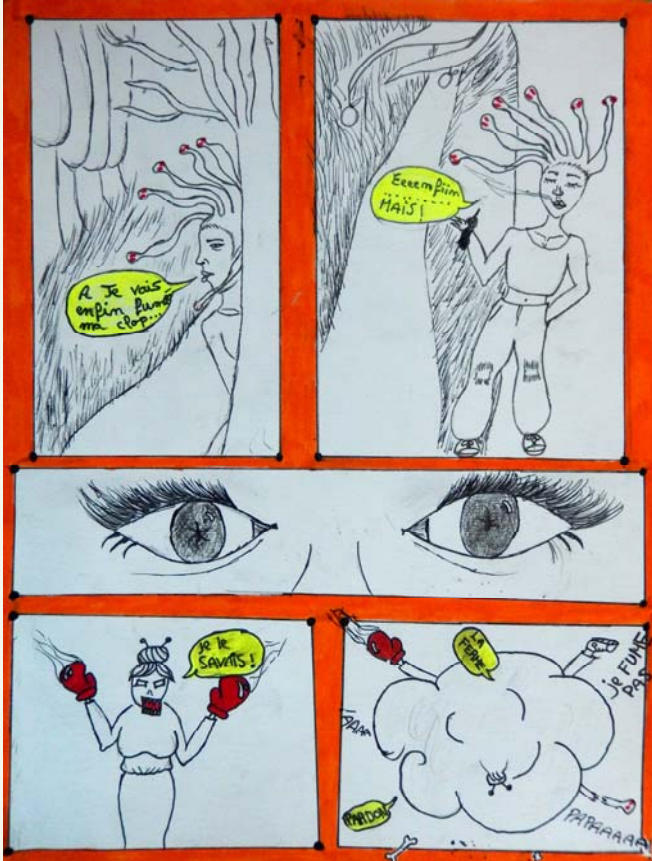
BD d'Alice 3e3