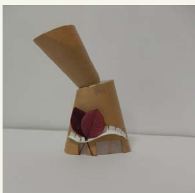
Cabane de Yasmine 4e5