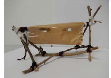
Cabane de GwennMaëlle 4e5

me coucher. Le lendemain, je me suis réveillée à 9 heures. L'après-midi, je suis sortie avec mes amies. On s'est rendues au parc pour jouer au ballon et, ensuite, nous sommes allées manger une glace. Elle était alléchante, excellente, raffinée, délectable. Le soir, j'en ai profité pour voir Star Wars au Figuier blanc. C'était géant et j'ai beaucoup ri. En bref, des vacances bien remplies mais je ne peux pas tout vous expliquer en détail . J'attends avec impatience les suivantes !