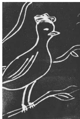
Gravure d'Alice Damba 3e3

Tous les mercredi soir, je vais à la piscine d'Argenteuil . Tout d'abord, on commence par s'échauffer : sauter, faire la brasse, le crawl, le dos crawlé... Ensuite, on apprend de nouvelles choses : on s'entraîne à plonger mais aussi à nager avec des palmes. Le plus difficile pour moi, c'est d'essayer de bien respirer