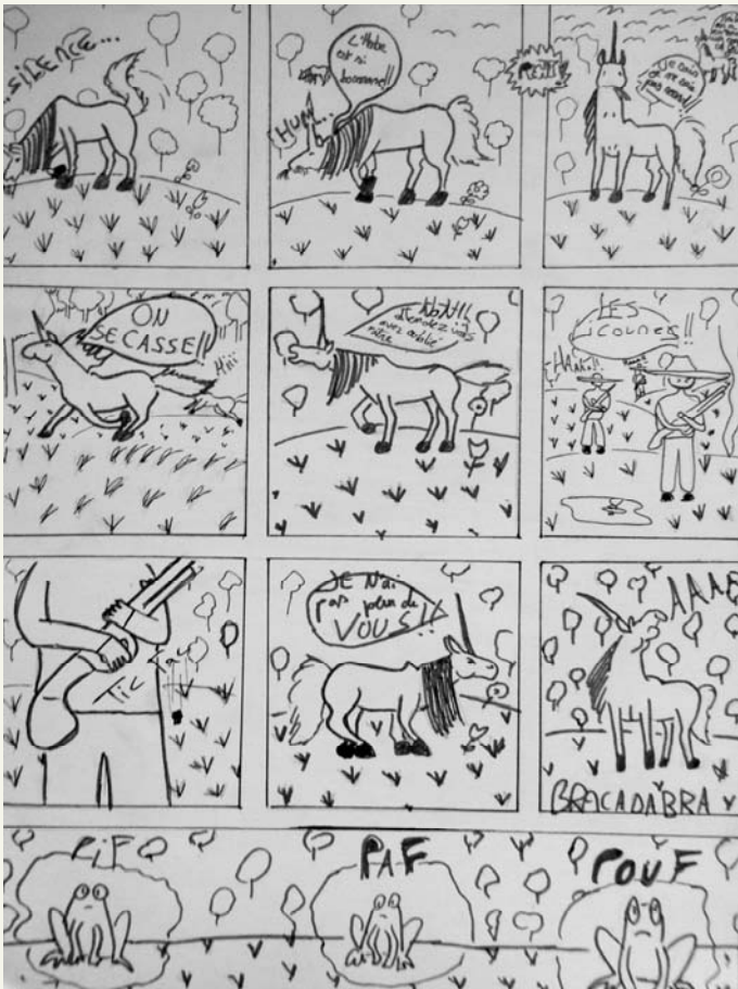
BD de Kinda Talawi 6°5